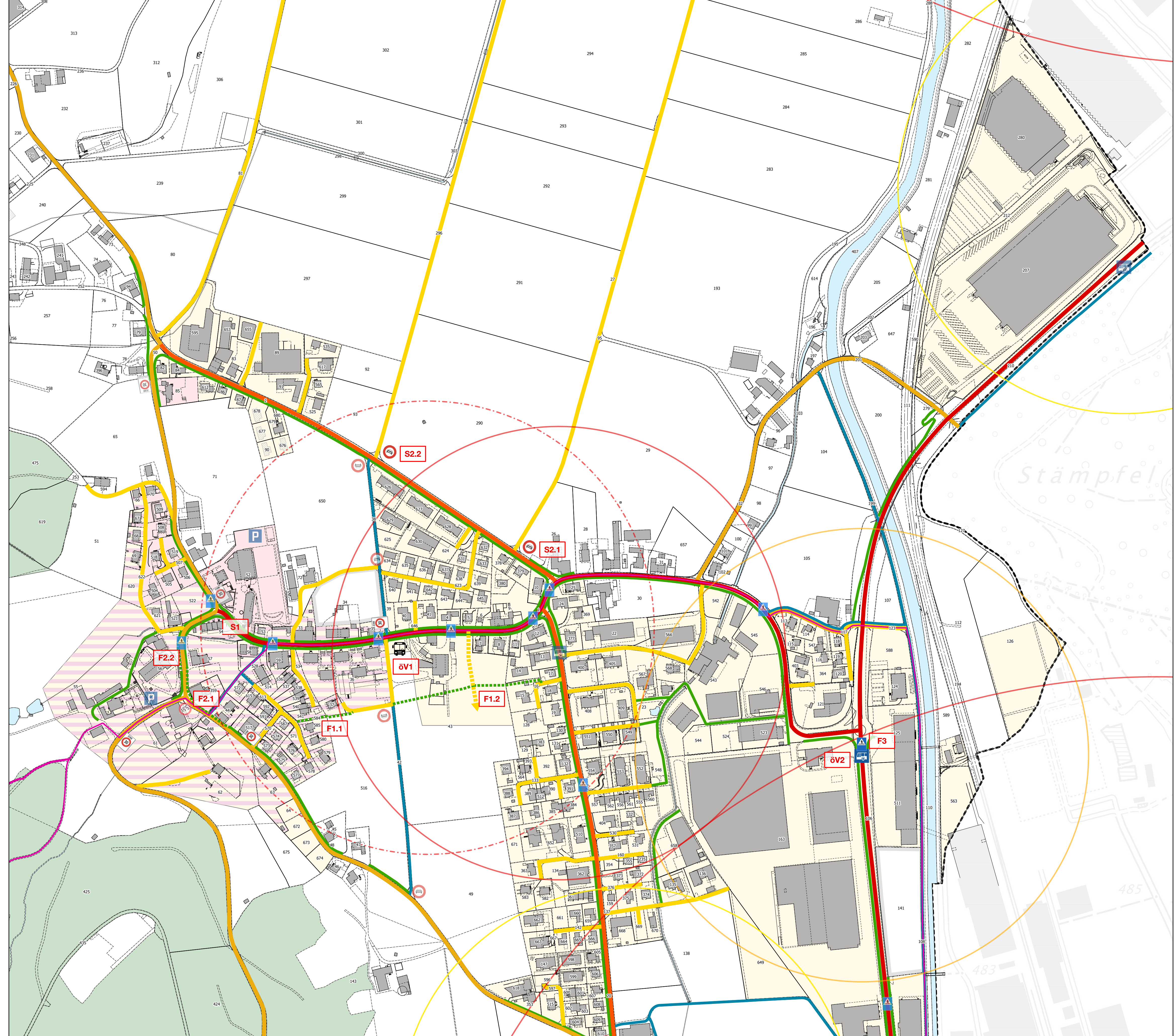
Ebersecken, Massstab 1:2'500

ÖV-Angebotsstufe 3: Sehr gutes Angebot, starke Marktstellung des ÖV Mindestangebot: Tagsüber i.d.R. durchgehender 30'-Takt mit Verdichtungsleistungen zu den HVZ Kurspaare/Std.: mind. 2 Kurspaare/Tag: mind. 32 - 61